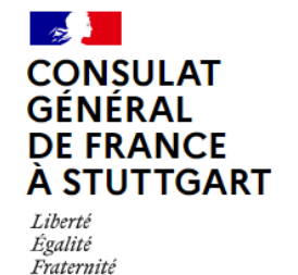
CONSULAT GÉNÉRAL DE FRANCE À STUTTART Liberté Égalité Fraternité