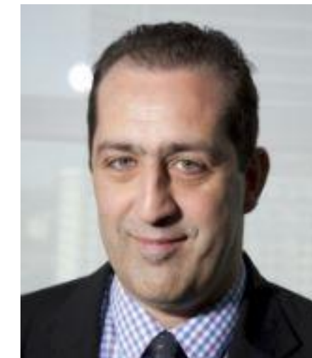
GAEL DE MAISONNEUVE CONSUL GÉNÉRAL DE LA RÉPUBLIQUE FRANCAISE POUR LE BADE-WURTEMBERG