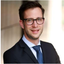
Timo Glasbrenner PR & Kommunikation